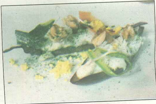
IL MENU Il gusto del personaggio di Vázquez Montalbán

privato galiziano, alter ego gourmet dello scrittore catalano, ma convincente e declinato in una ricca sequenza di piatti rivisitati con estro. Nella categoria "Centrotavola" olive Kalamata calde schiacciate agli agrumi appena piccanti, taramà, simit turco ai semi di papavero, ekmet ai semi di sesamo, "chapati e naan" e pane targato Alex; come entrées pane e pomodoro in boccone e crostino di pane nero con crema di ricotta agli agrumi, marmellata di zucca, capocollo Mocarero e caffè di cicoria; in antipasto melanzana e Pil-Pil (melanzana lunga, baccalà in due consistenze-mantecato e a bassa temperatura, crudité, noci, neve d'olio Donna Oleria alla curcuma e pol-